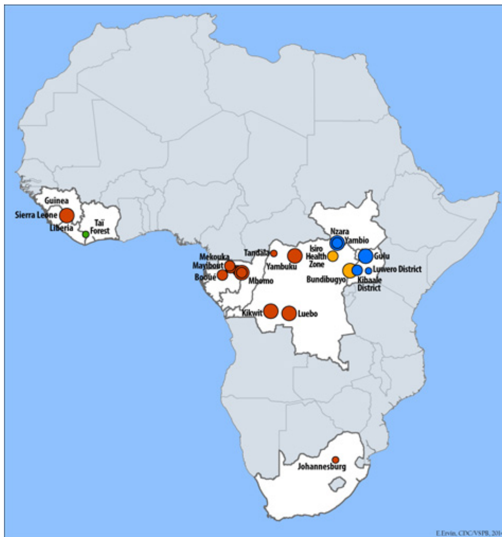
EBOLAVIRUS OUTBREAKS BY SPECIES AND SIZE, 1976 - 2014